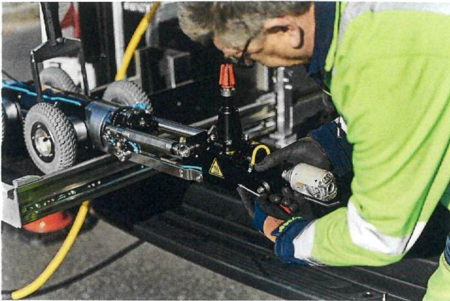
Hütchen und Manschetten setzen, Mörtel verpressen, Höchstdruckfräsen und Inspizieren – Aufgaben, die mit dem MicroGator Fahrzeugsystem für elektrisches Fräsen im Hauptkanal realisiert werden können.