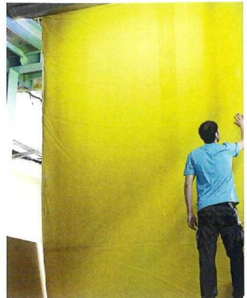
Geprüfte Qualität: Endkontrolle des Impreg-Liners

rungen berichtet wird. Darüber hinaus laden die Stände der Unternehmen und Verbände in der begleitenden Fachausstellung die Besucher zur intensiven Diskussion ein.