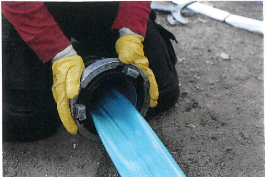
Das Schlauchlinerverfahren Mr. Pipe-Liner ist für alle Hausanschlussleitungen (Abwasser und Regenwasser) geeignet – u.a. bei Wurzeleinwüchsen, Scherbenbildung oder fehlenden Scherben, Rissen sowie verschobenen Verbindungen. Ergänzt wird das Verfahren durch den ebenfalls DIBT-zugelassenen Mr. Pipe-Stretch-Liner für die Sanierung von Leitungen mit drei verschiedenen Dimensionen/Nennweiten.