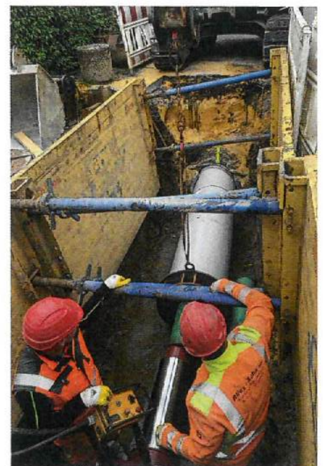
Thermoplastische Kunststoffrohre von Simona eignen sich aufgrund ihrer Eigenschaften zum Anpassen an die beschädigten Rohre hervorragend für dieses Verfahren und bieten eine langlebige und wartungsarme Möglichkeit für beschädigte Altleitungen.

Kritischen Fragen wie diesen soll laut Hippe auf dem diesjährigen Reparaturtag in Düsseldorf auf den Grund gegangen werden. Was ist die richtige Strategie, um das Kanalnetz in einem guten Zustand zu halten? Bei der Beantwortung dieser Frage herrscht mittlerweile Einigkeit in der Branche, dass im Vorfeld dem Planer eine entscheidende Rolle zukommt, wenn es um die Qualität und damit auch Nachhaltigkeit der Sanierung geht. Anschauen, analysieren und die richtige Entscheidung treffen – in dieser Hinsicht weist der Reparaturtag durchaus Schnittmengen zum Schlauchlinertag auf.