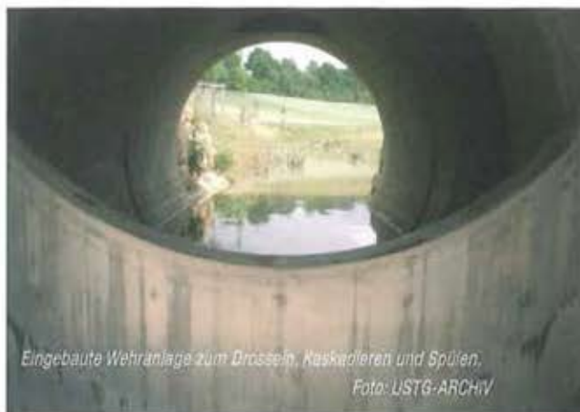
Eingebaute Wehranlage zum Drosseln, Kaskadieren und Spülen.

von ohnehin erforderlichen Sanierungsmaßnahmen im Kanalnetz sinken die Investitionen für nachträgliche Abwärmenutzung auf ein attraktives Niveau.