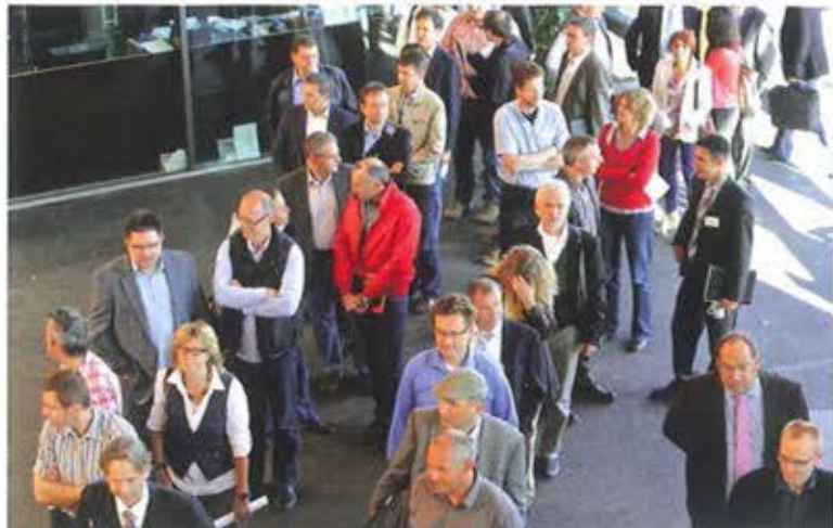
Knapp 300 Teilnehmer kamen zum 1. Deutschen Kanalnetzbewirtschaftungstag am 6. Juni 2013 in Geisingen – darunter auch Fachleute aus Deutschland, Frankreich, Spanien, Belgien, Portugal und den USA.